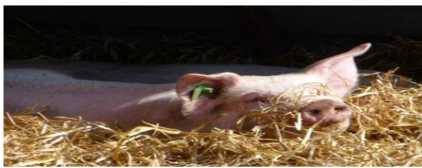
Frilandsgris i halm av Sissel C Endresen

Innovasjon Norge har for 2023 auka pott til å støtte investeringar i landbruket. I dei regionale retningslinene er tiltak som gjeld dyrevelferd og støtte til omlegging til SPF-gris prioritert.